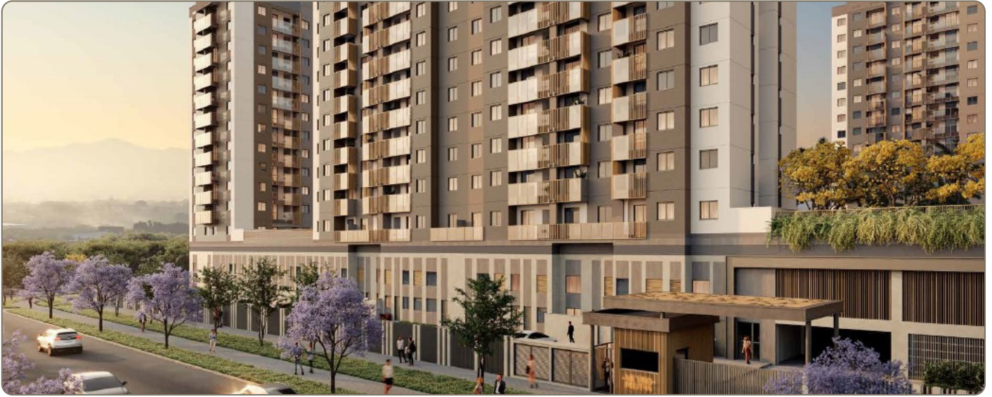
Perspectiva Ilustrativa da fachada e entrada do empreendimento residencial lançado pela Cury e Grupo Teruszkin.

Lançado no segundo semestre de 2024, o METROPOLITAN DREAM, lançamento da Cury e Grupo Teruszkin, conta com unidades de loft, apartamentos com 1, 2 e 3 quartos. Um condomínio completo com Rooftop, piscinas, churrasqueiras, easy market, pet place, oficina e playground. Contando com uma área de 15.963,09 m 2 , com um total de 806 unidades distribuídas em 5 blocos. A promessa de entrega da obra será em 2028, onde o bairro certamente irá ter um acréscimo considerável de moradores, trabalhadores e visitantes, dado o volume de novas unidades do empreendimento.