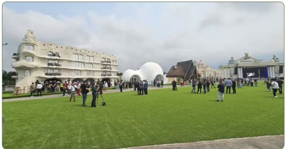
Global Village ficará fixo na área do Parque Olímpico.

O anúncio foi feito na Cidade do Rock, com a presença do empresário Roberto Medina, criador do festival, e do atual prefeito Eduardo Paes. O impacto econômico previsto com a chegada do IMAGINE, prevê um retorno anual de R$ 9,2 bilhões em um período de 30 anos. A expectativa é que 143 mil novos empregos sejam gerados ao longo do desenvolvimento do projeto.