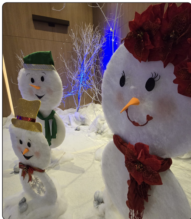
Fotos da festa de final de ano de dezembro de 2024, promovida pela Associação do Centro Metropolitano.

A ACM organizou uma festa de final de ano incrível para as famílias, trabalhadores, lojistas e frequentadores do bairro. Este evento já faz parte do calendário de ações da ACM. Foi uma manhã maravilhosa, tudo foi organizado com muito carinho no espaço do Union Mall e Union Suites. O cenário ficou deslumbrante, contando com espaços instagramáveis e é claro, trazendo ao público um espaço maravilhoso e personalizado para a foto com o bom ve-