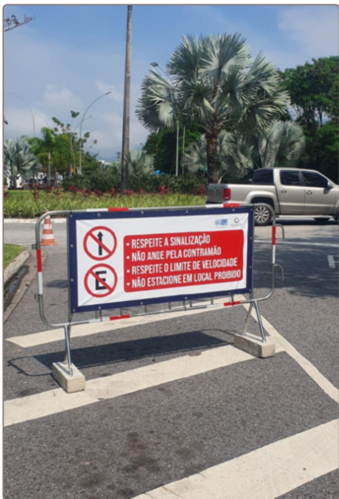
Apelos com ênfase ao respeito da sinalização de trânsito.