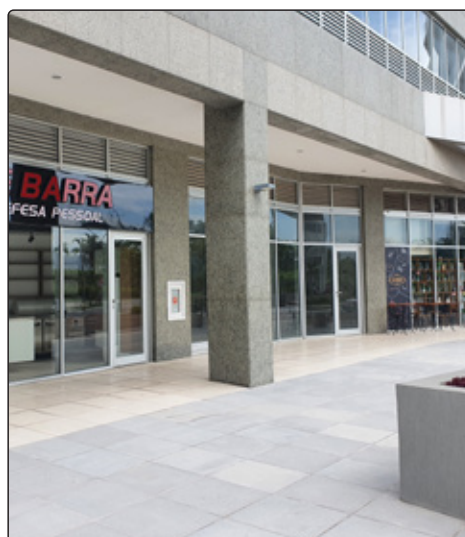
Lojas no Union Mall.