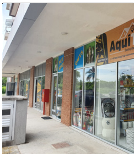
Galeria de lojas Soho Residence.