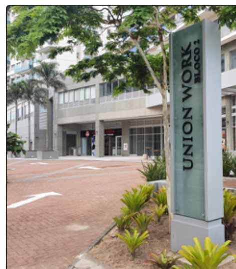
Escritórios no Union Work.