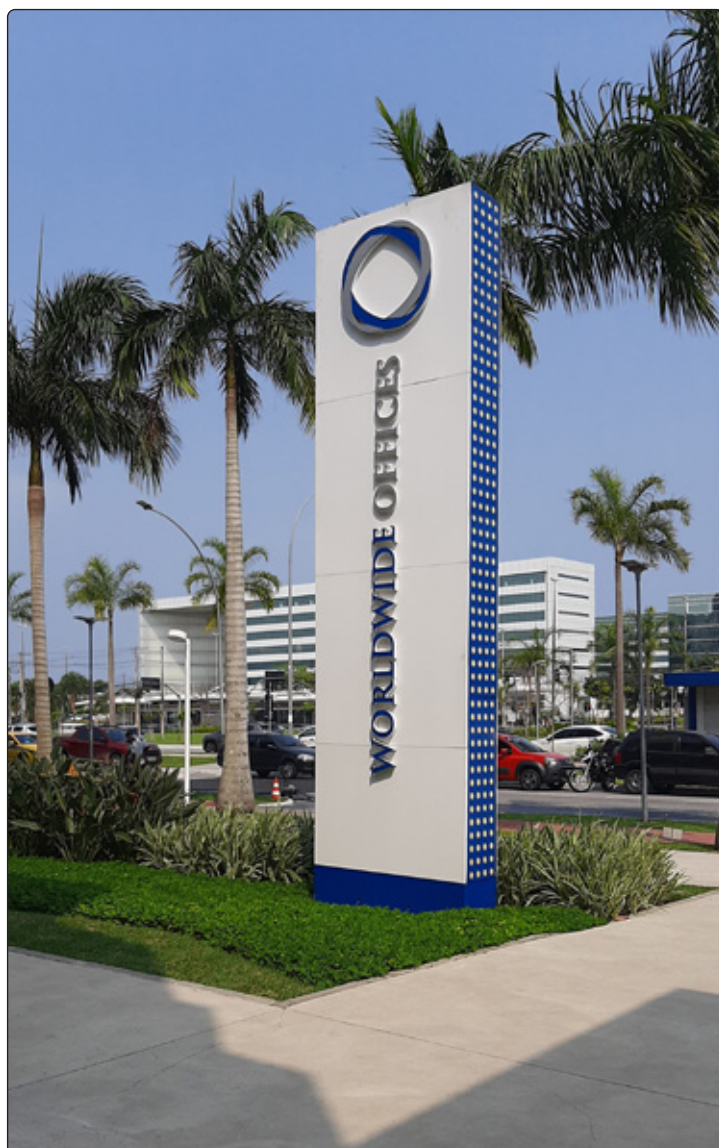
Condomínio WWO na entrada do bairro.

Não é novidade pra ninguém que o Centro Metropolitano Barra vem crescendo em número e qualidade com opções de serviços e conveniência inauguradas e também aquelas que já estão consolidadas nos condomínios World Wide Offices, One World Offices, Union Work, Union Mall e Soho. Aqui no bairro encontramos inúmeras opções de serviços que giram em atividades diversas como escritórios de advocacia, tecnologia da informática, imobiliárias, corretoras de seguro, escritórios de publicidade, arquitetura, decoração, móveis planejados, co-working, consultórios com várias especialidades, clínicas para cuidados estéticos e de bem-estar, espaços fitness de personal trainers, crossfit, artes marciais, cursos para adultos, jovens e crianças. As opções em gastronomia são muitas. Aqui no bairro o morador, trabalhador ou frequentador encontram opções diversas nos restaurantes que oferecem sanduíches, hambúrgues artesanais, pizzas, massas, frutos-do-mar, japonês food, sucos, sobremesas, tortas, bolos e doces artesanais. VALE LEMBRAR QUE OS EMPREENDEDORES DO BAIRRO PODEM CADASTRAR SUA EMPRESA NO CAMPO DE BUSCAS DO SITE DA ACM: ( https://www.acmrj.com.br/cadastro ). Para que este processo continue crescendo, a participação do público consumidor local é muito importante. O Centro Metropolitano é um bairro onde você pode morar, trabalhar e consumir de quase tudo um pouco. Prestigie o empreendedor local para o fortalecimento do comércio e serviços disponíveis.