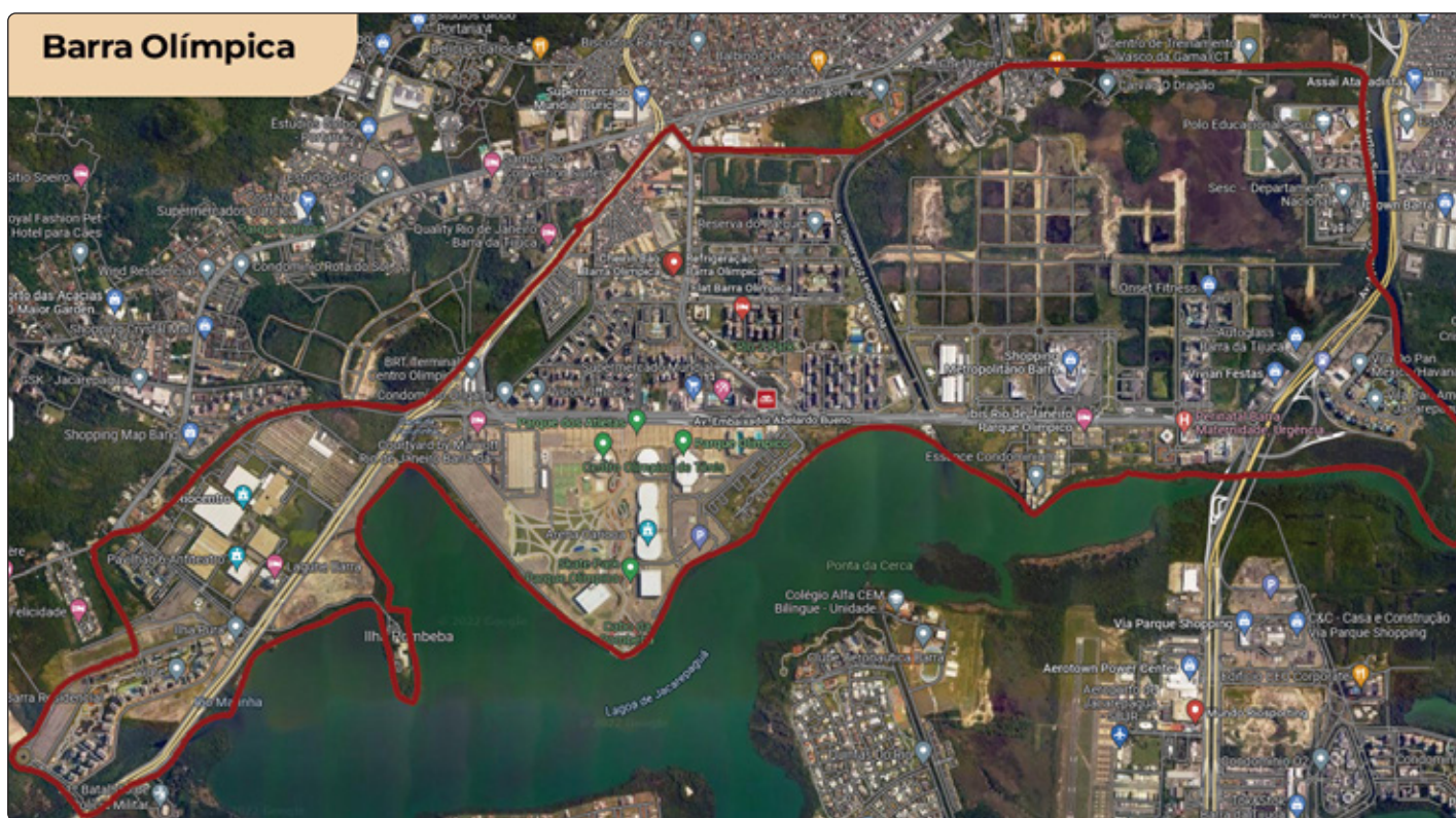
O Centro Metropolitano agora faz parte da criação do mais novo bairro da Prefeitura do Rio de Janeiro: o Barra Olímpica. pg.8

BARRA OLÍMPICA É O MAIS NOVO BAIRRO DA CIDADE DO RIO DE JANEIRO. ENTREVISTA COM CARLO CAIADO (PG. 8)