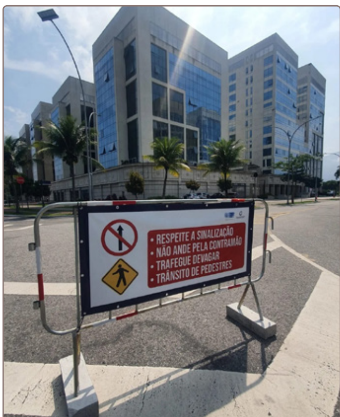
Inaugurada a campanha educativa por um trânsito seguro.

A ACM inaugurou sua campanha de caráter educativo no bairro com o propósito de incentivar as boas práticas em diferentes segmentos. Esta iniciativa é um apelo para que as nossas áreas comuns possam com o apoio de todos continuar a ser este lugar agradável, conservado e prazeroso. É bem verdade que chegam inúmeros pedidos e solicitações em forma de flagrantes de práticas irregulares como excesso de velocidade, o que já foi bem neutralizado com a instalação de redutores de velocidade (quebra-molas) nas ruas e avenidas, carros estacionados em lugares proibidos, uso de atalhos e contramão por carros particulares, motoristas de aplicativos, serviços de entrega de motoqueiros, caminhões e utilitários. Neste primeiro momento nossos avisos serão direcionados para indicar boas práticas voltadas para o tráfego de veículos pelas ruas do bairro. Acreditamos que os avisos de sinalizações distribuídos pelo bairro atuarão como fortes aliados para que práticas equivocadas no trânsito sejam evitadas. Contamos com a colaboração de todos os moradores, trabalhadores e frequentadores do bairro. A consciência de todos é super importante para o sucesso desta iniciativa.