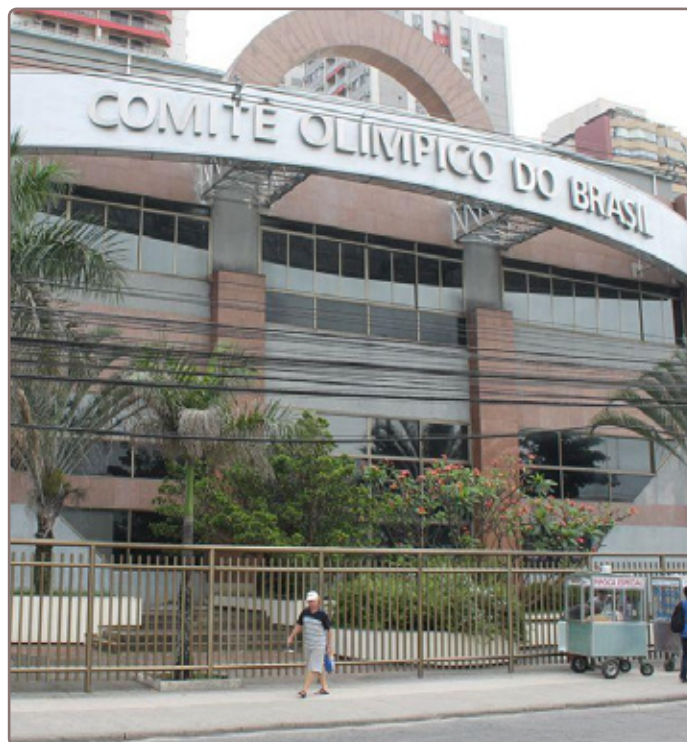
Antiga sede do COB (Comitê Olímpico do Brasil) na Avenida das Américas.

dos condomínios, o que é ótimo também para o fortalecimento dos negócios no bairro, mediante a procura de serviços e conveniência local. Fonte: https://www.cob.org.br/pt/galerias/noticias/cob-inicia-processo-de-mudanca-para-nova-sede-administrativa/