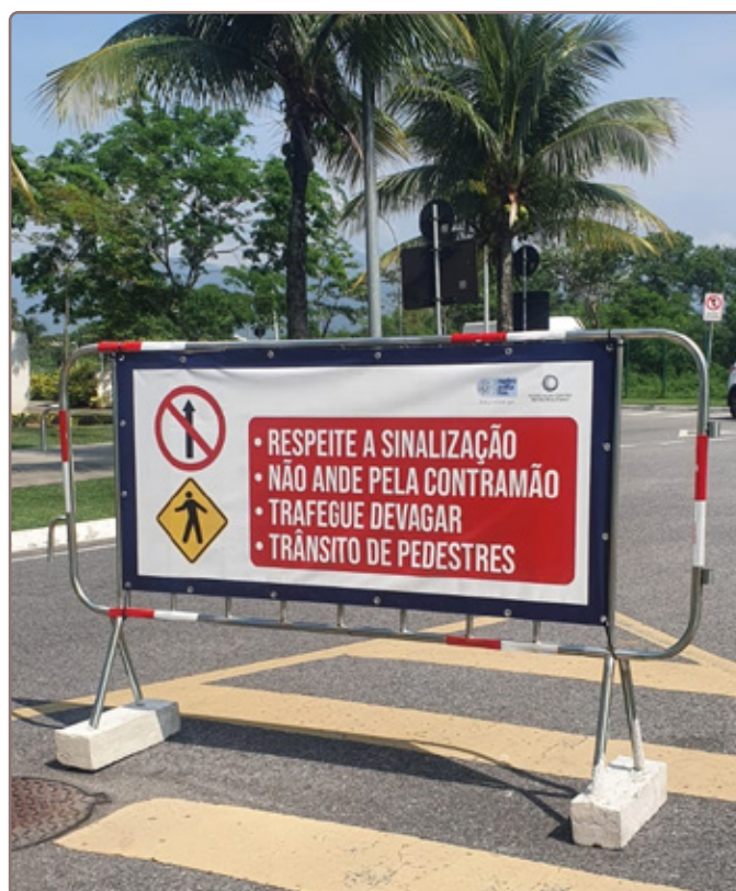
Sinalização distribuída pelas ruas e avenidas do bairro.