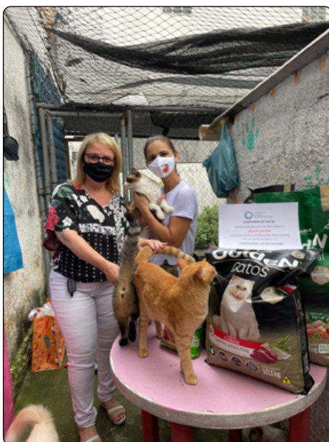
Entrega de doações no GATIL DA DANI