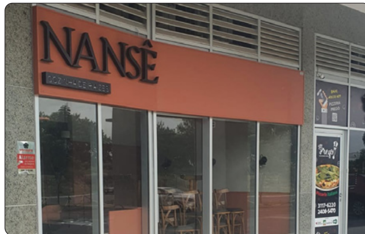
Nansê - Cozinha