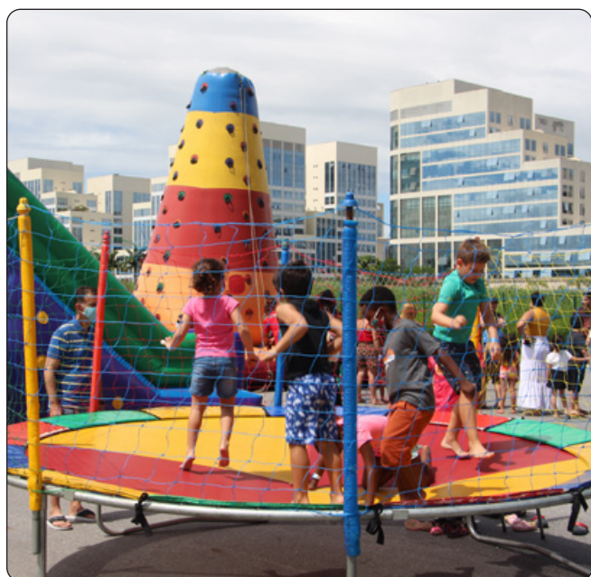
Pula-pula, escalada, escorrega e recreação de montão!

O grande momento da festa foi a CHEGADA DO PAPAÍ NOEL, trazido pelo carrinho decorado da ACM, transmitindo muita energia, o Papai Noel fez a festa das crianças que com cartinhas nas mãos foram uma a uma tirar uma foto com o bom velhinho.