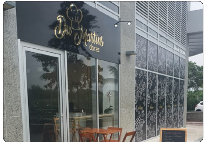
Du Martins - Doces