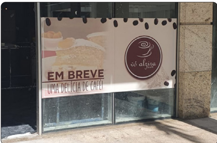
Vó Alzira - Bolos