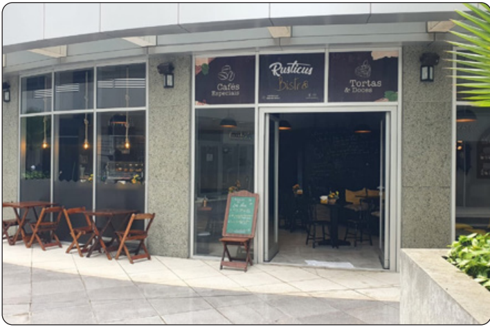
Rusticus - Bistrô