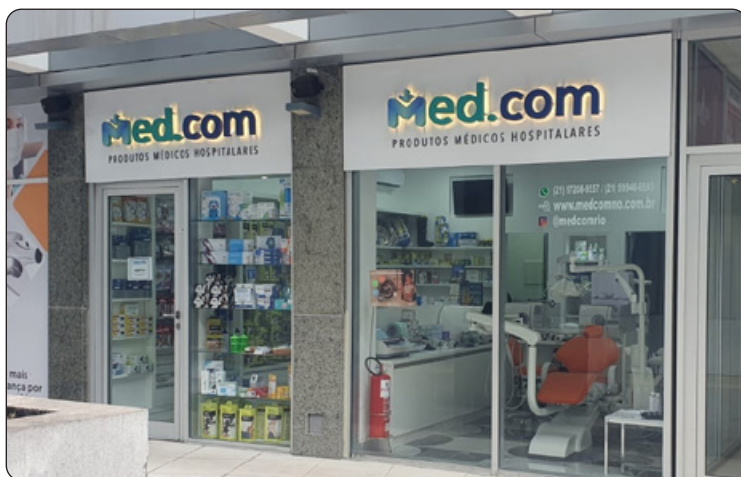
MED.COM - Produtos Médicos Hospitalares