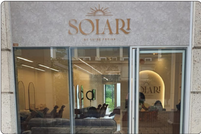
Solari - Estética