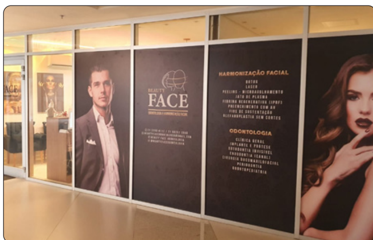
Beauty Face - Harmonização Facial e Odontologia