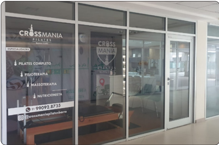
Crossmania - Pilates