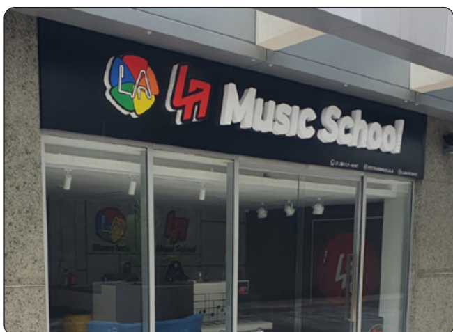
La Music School - Escola de Música