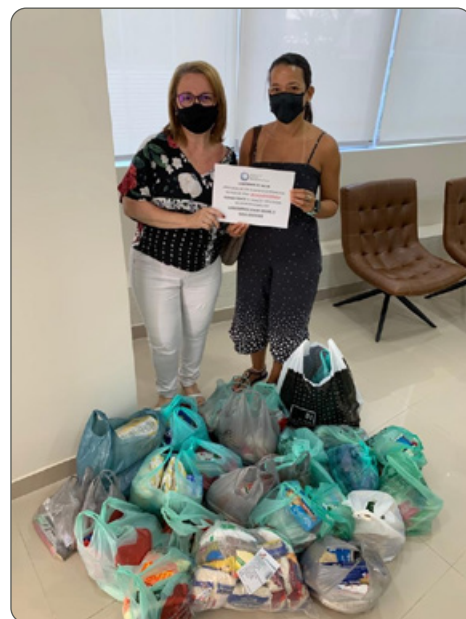
Entrega de doações p/ o EU AJUDO COMO DÁ