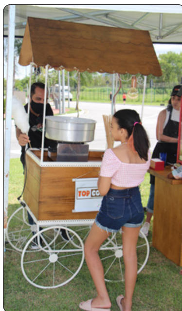
Algodão doce, pipoca e picolé para a garotada.