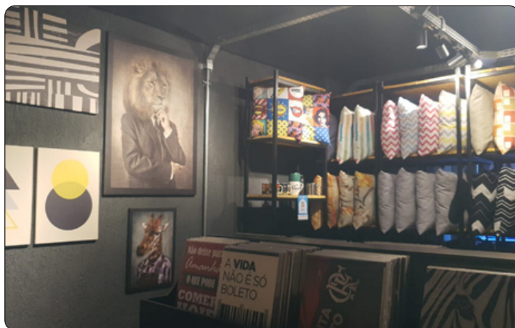
ARTDecor260 - Artigos de Decoração e Personalizações

Para os empreendedores locais, acesse nosso site www.acmrj.com.br e no menu SERVIÇOS cadastre a sua empresa de forma segmentada no campo de buscas do nosso site. Assim, a sua visibilidade só aumenta, e todos os moradores podem ficar por dentro do seu negócio. Aproveite!