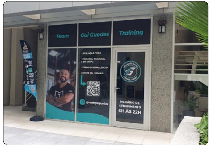
Team Gui Guedes - Training