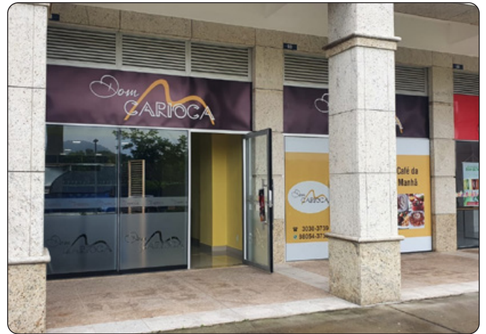
Dom Carioca - Restaurante