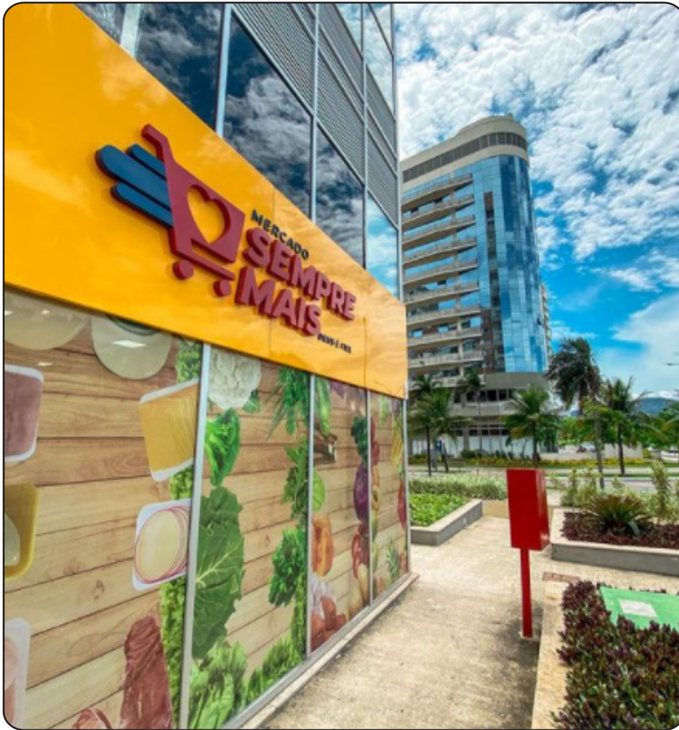
MERCADO Sempre Mais - Recém inaugurado aqui no Centro Metropolitano.