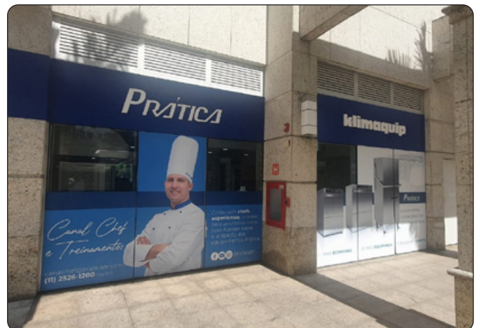
Prática Klimaquip - Fabricante de Equip. Gastronomia