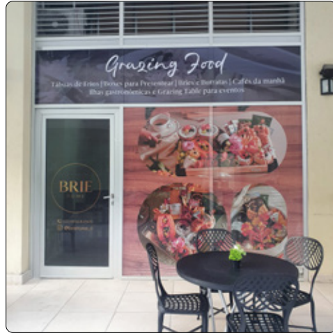
Grazing Food - Union Mall