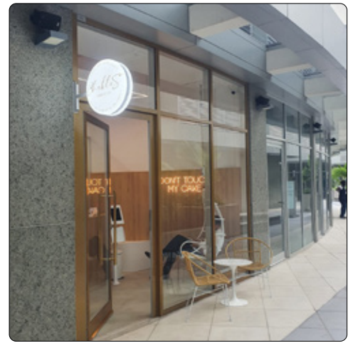
Chebles - Union Mall