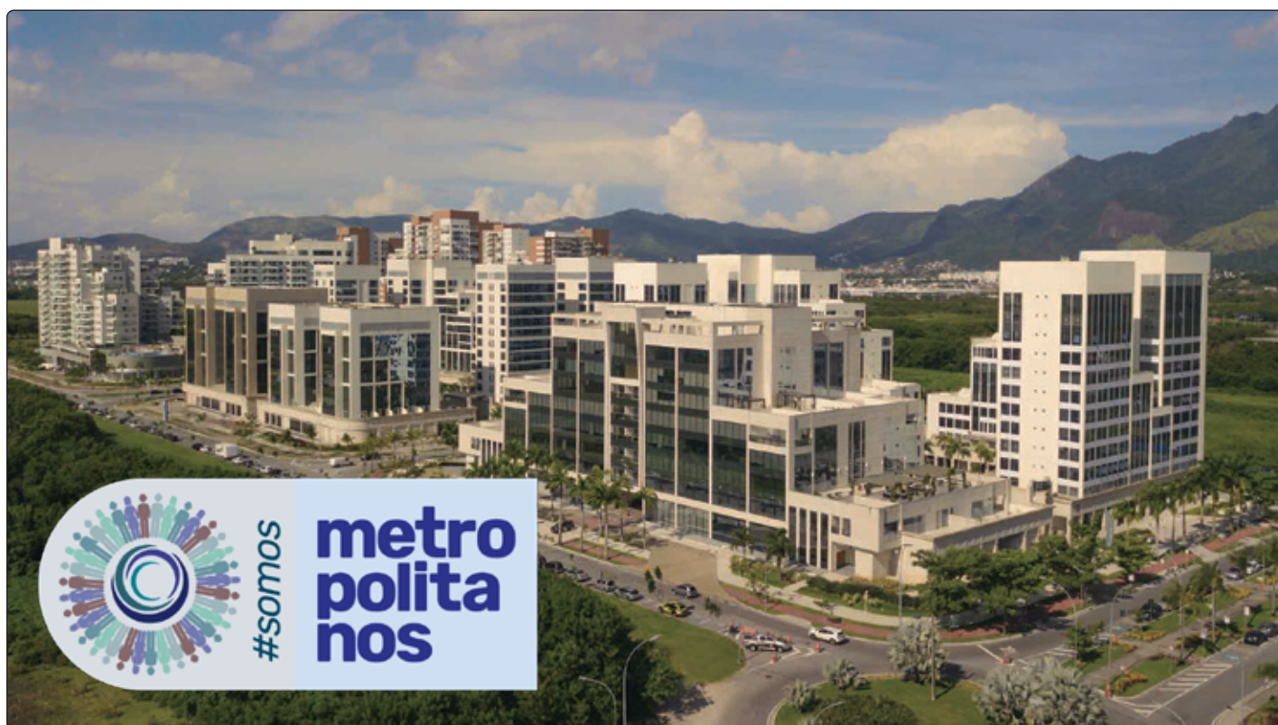
Associação do Centro Metropolitano lança uma nova marca para divulgação de boas práticas. pg. 4

ASSOCIAÇÃO CRIA UMA MARCA PARA DIVULGAÇÃO DE CAMPANHAS DE BOAS PRÁTICAS NO BAIRRO. CONFIRA.