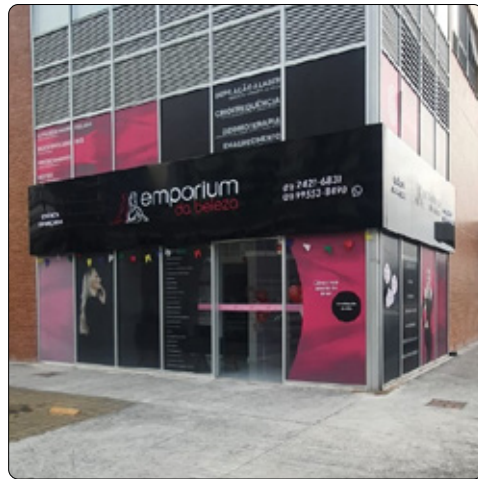
Emporium da Beleza - Soho Residence