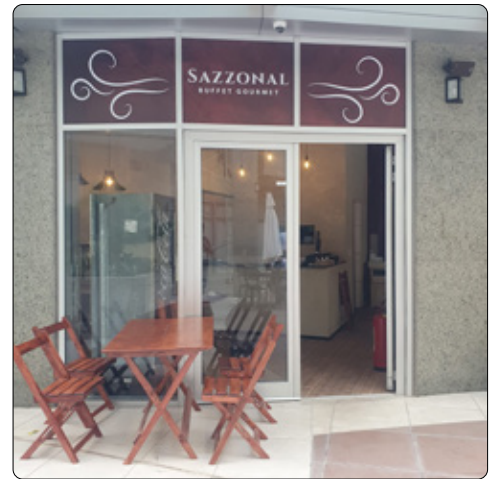
Sazzonal - Union Mall