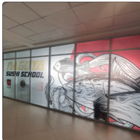
Nagoya Suchi School - Union Mall