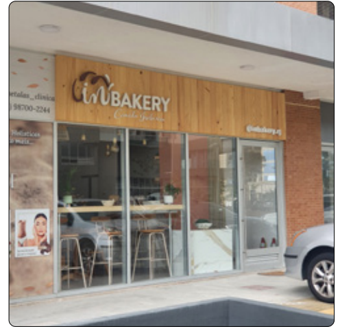
In Bakery - Soho Residence