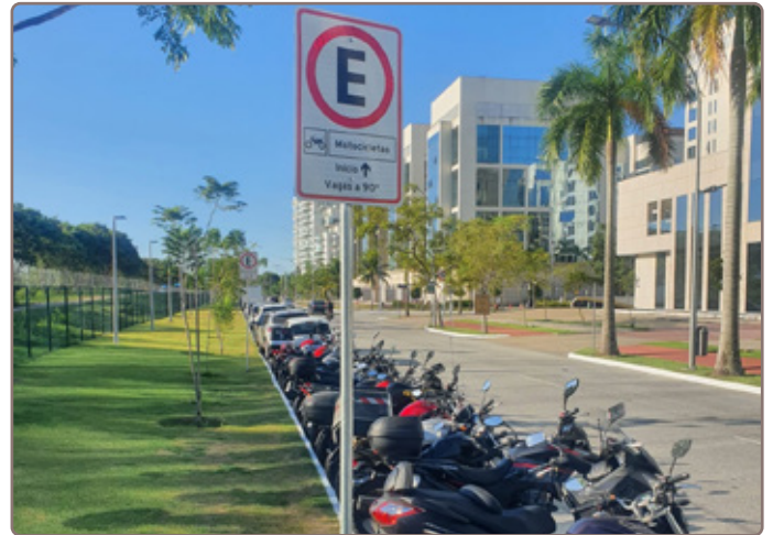
Implantação de local sinalizado e reservado para estacionamento exclusivo de motos.