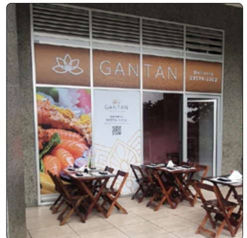
Gantan - Union Mall