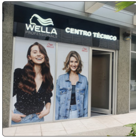
Centro Técnico Wella - Union Mall

As novidades não param no Centro Metropolitano que está em franca expansão com a inauguração de novas opções em serviços e conveniência nas lojas distribuídas pelos condomínios do bairro. Hoje contamos com farta gastronomia, desde almoços, cafés da manhã, lanches da tarde, tratamentos estéticos e opções para quem deseja fazer exercícios físicos, cursos e muito mais. Confira as últimas novidades e apoie o empreendedor local.