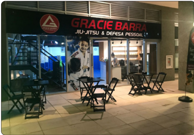
Unidade Gracie Barra Metropolitano.