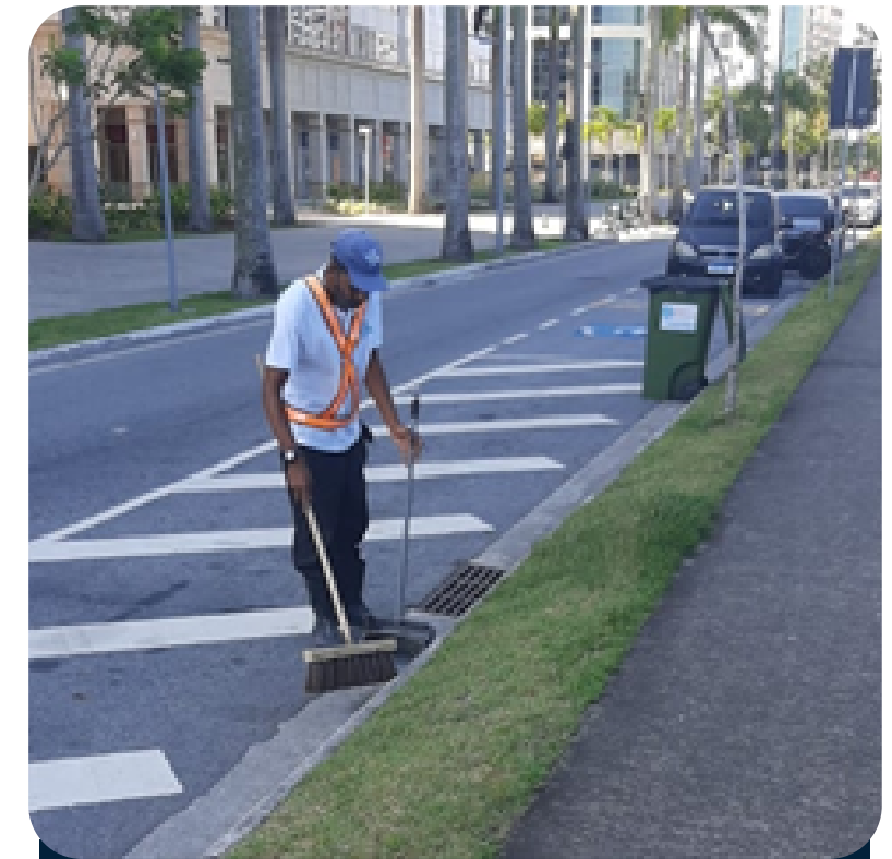
Varrição das Ruas