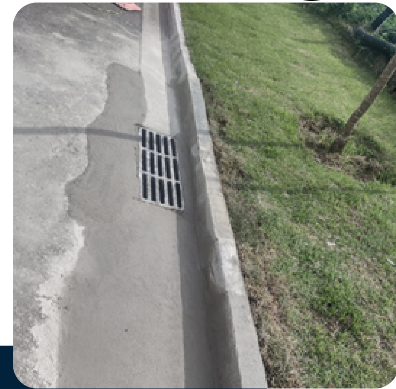
Manutenção Meio Fio