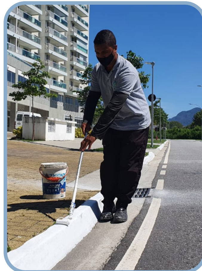
Pintura Meio Fio