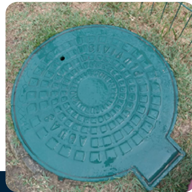
Pintura de Tampa