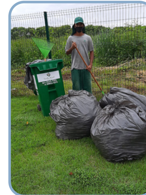
Varrição após roçagem