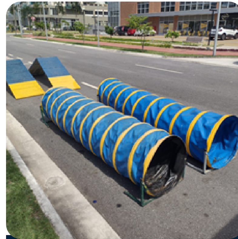
Limpeza brinquedos Play Dog