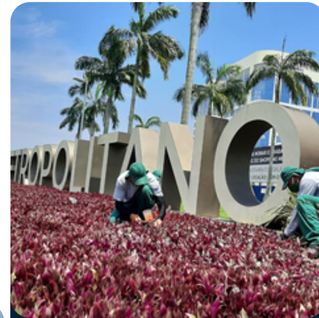
Limpeza e Manutenção Bosque