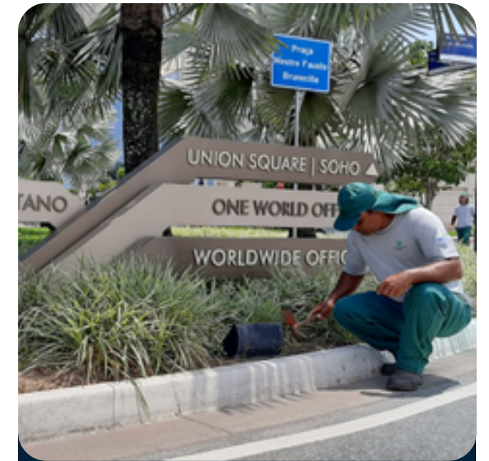
Limpeza e Manutenção Rotatória