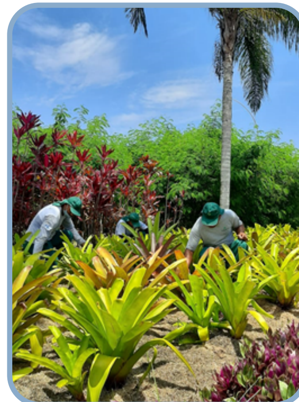
Poda de árvore