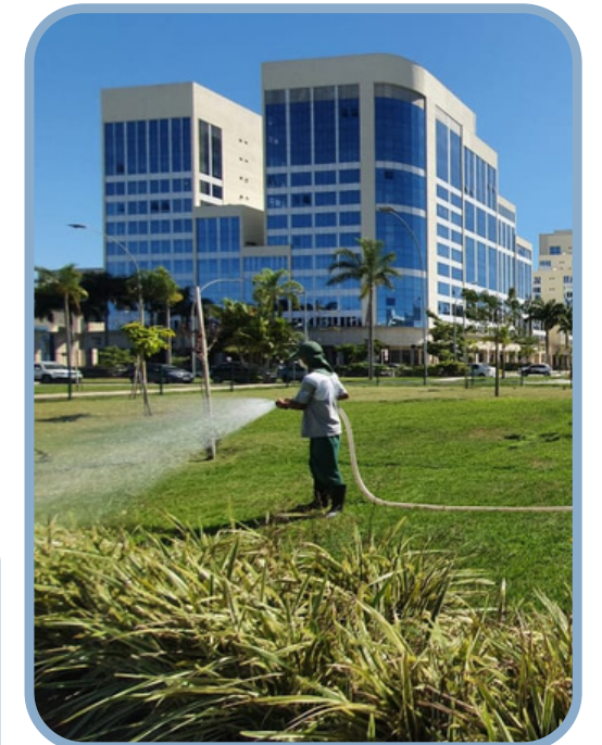
Irrigação do Jardim