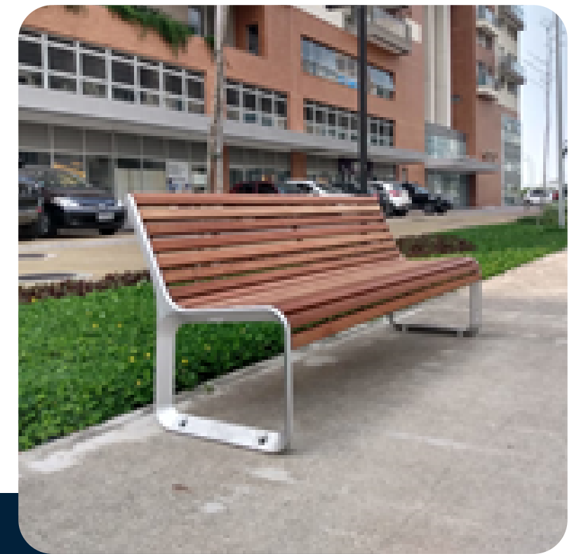
Limpeza dos equipamentos urbanos