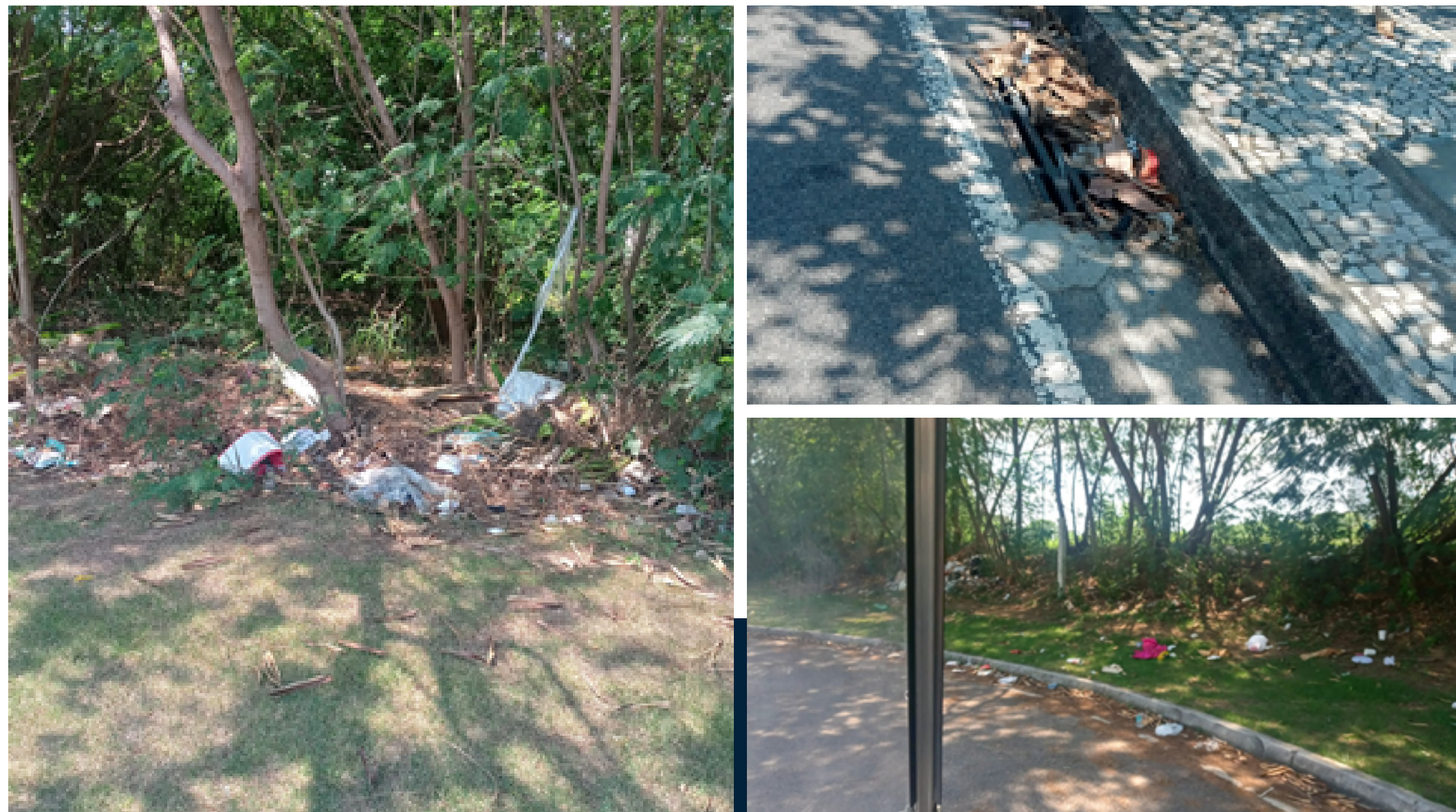
Ruas do entorno do Universe