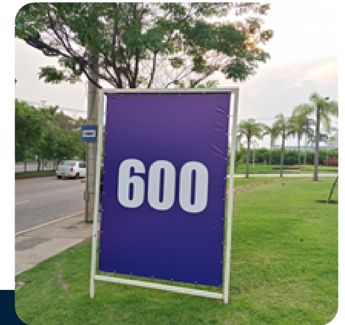
Substituição de Lona