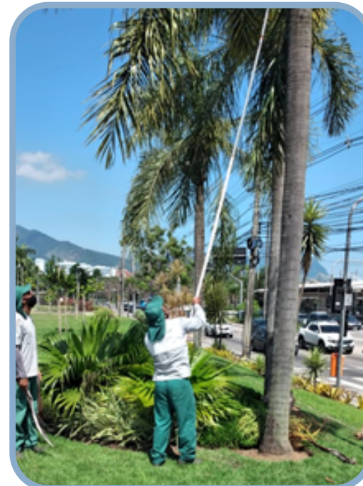
Poda de árvore