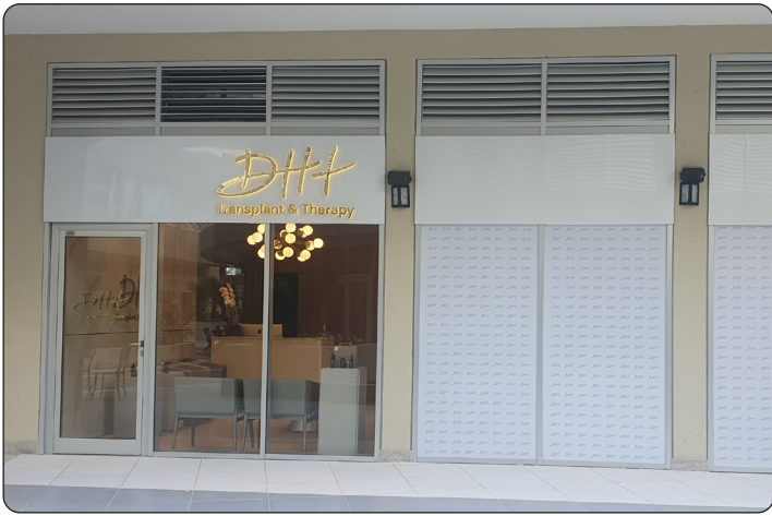
DH + Implantes Capilares