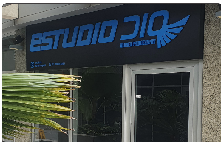
ESTUDIO DIO - Estudio Fotográfico