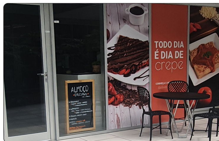
OLIVETOS - Creperia