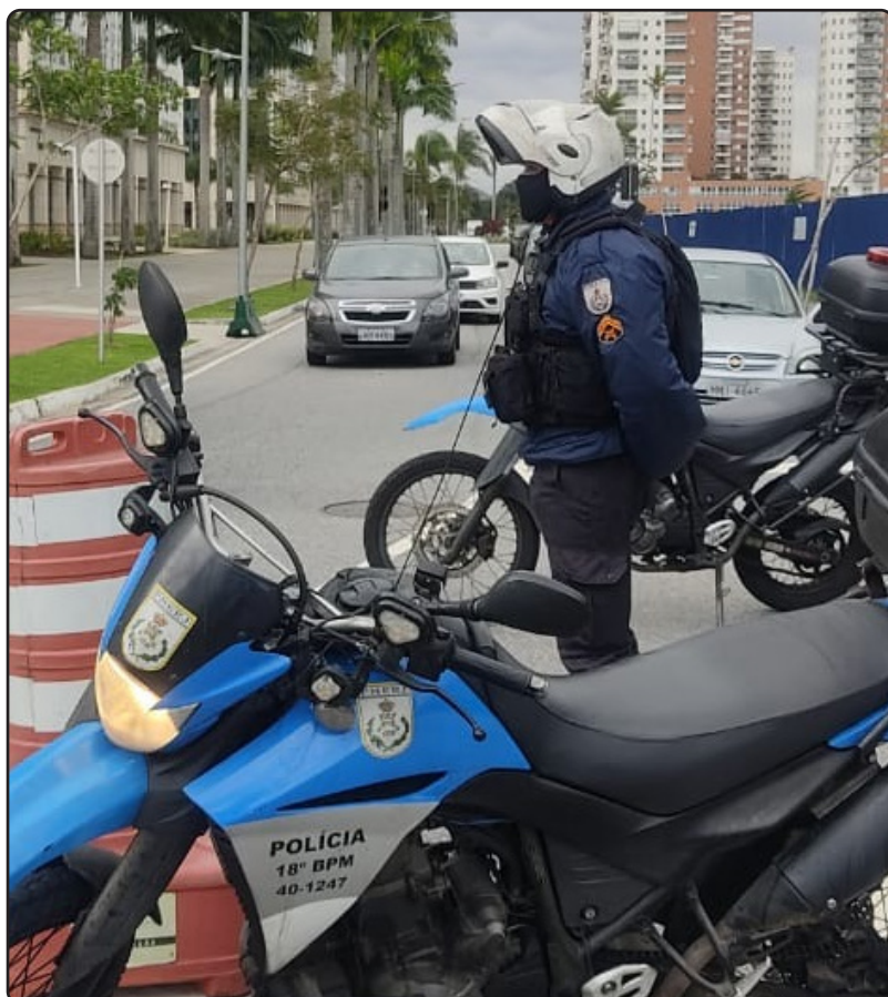
Foto Policial Militar 18º BPM em exercício no programa Bairro Seguro.

Um dos objetivos do programa é de construir uma relação de confiança entre moradores, comerciantes e os profissionais da PMERJ.