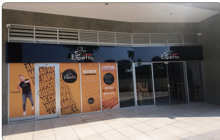
SR. ESPETTO - Restaurante

A ACM através do seu informativo traz um pouco destas novidades para que todos possam conferir os serviços que estão sendo inaugurados no bairro. Para quem ainda não visitou as avenidas do Union Mall fica a dica. Continuem acompanhando as novidades do bairro também pelo nosso site: www.acmrj.com.br