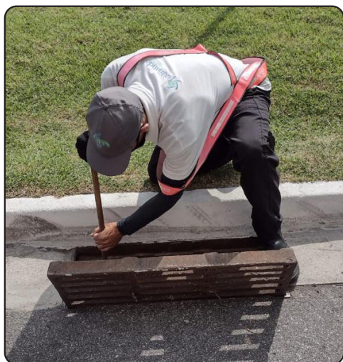
Trabalho de limpeza das galerias pluviais.