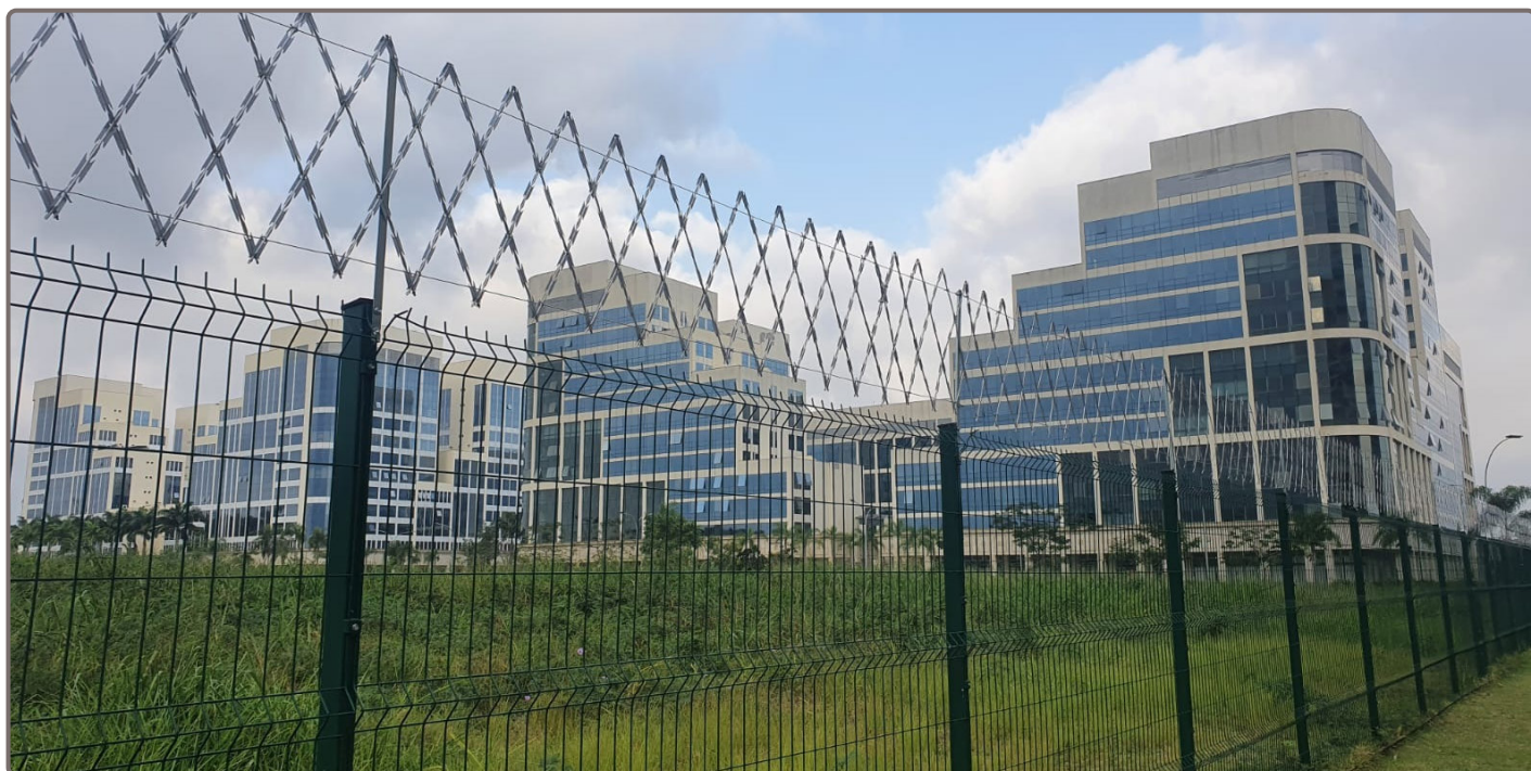
Redes de proteção instaladas no entorno das ruas e avenidas do bairro.

Dando continuidade nas ações da Associação para aumentarmos a segurança do nosso bairro, fizemos no mês de agosto a instalação de redes de proteção por todo o perímetro que circula as ruas e avenidas do Centro Metropolitano. Esse foi um tema que nos últimos meses ganhou relevância por conta da exten-