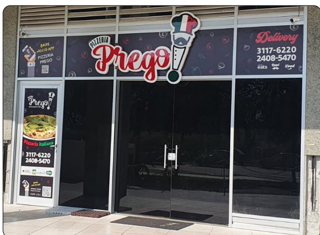
PREGO - Pizzaria