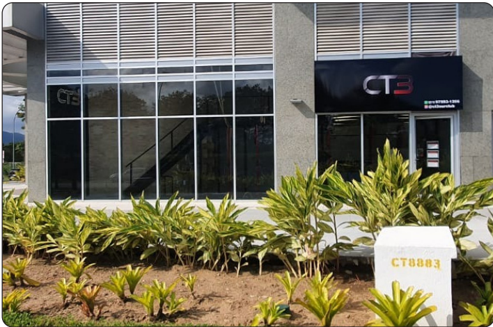
CT3 - Exercícios e Treinos