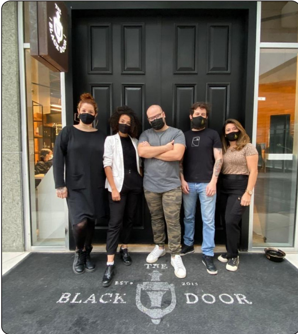
Equipe de profissionais do The Black Door Salon no Union Mall

LOTUFO é o nosso entrevistado do mês aqui no informativo da ACM e vai contar curiosidades acerca do Black Door, novo salão recém-inaugurado no Union Mall.