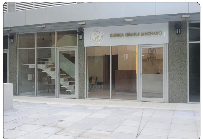
CLÍNICA ISRAELE MACHADO - Harmonização Facial