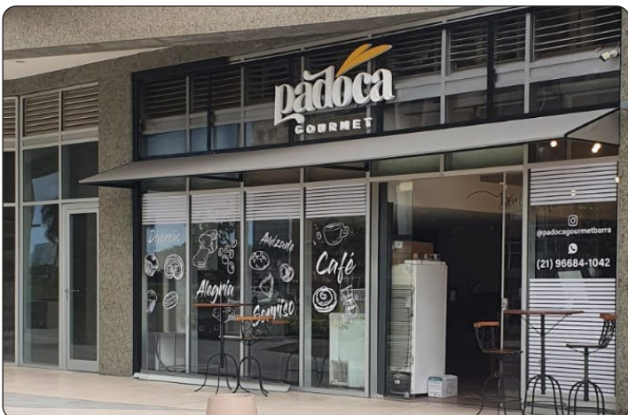
PADOCA GOURMET - Padaria