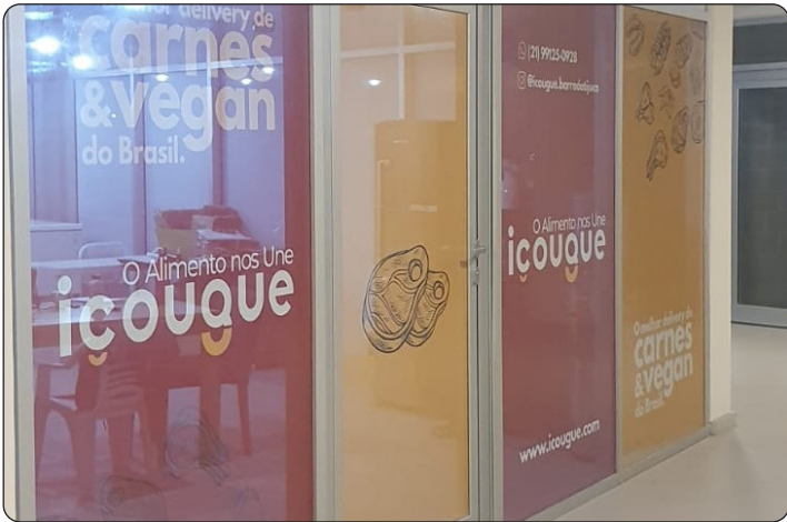
IÇOUQUE - Delivery de Carnes e Vegan