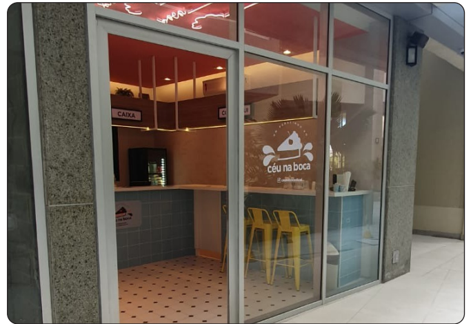
CÉU NA BOCA - Tortas