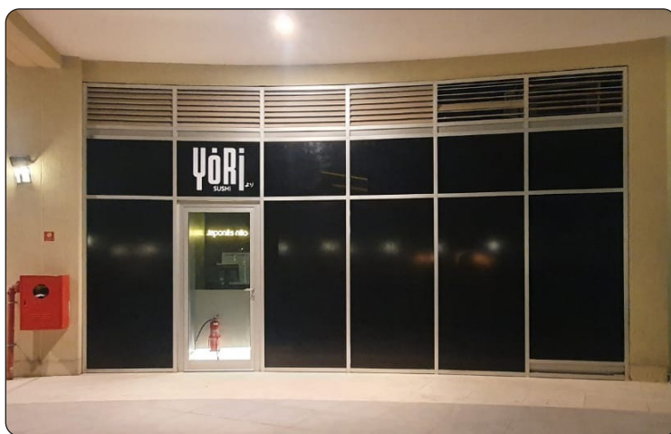
YÓRI - Comida Japonesa