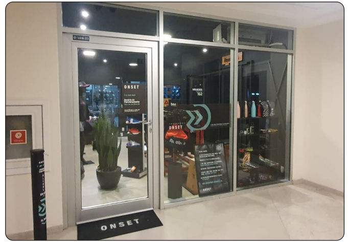
ONSET - Materiais Esportivos