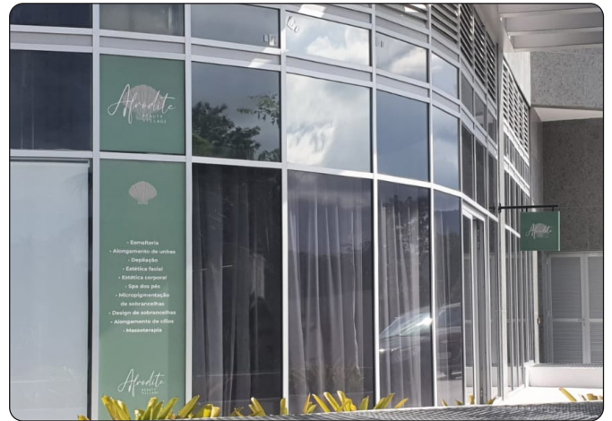
AFRODITE - Esmalteria