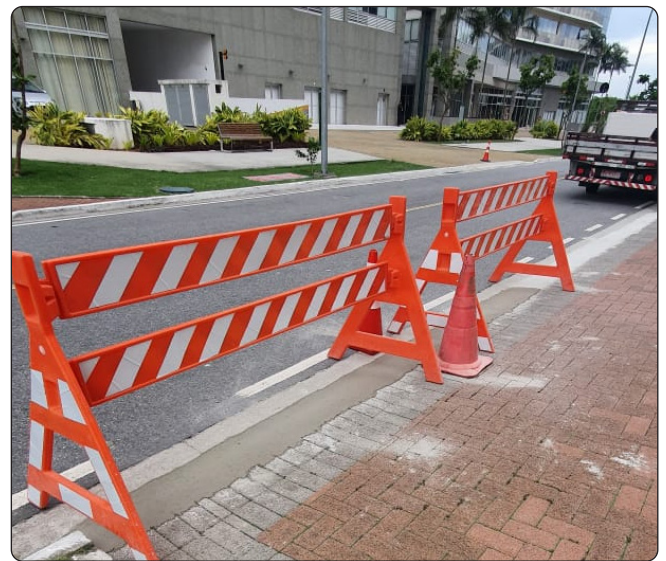
Manutenção de meio-fio feita nas ruas do bairro.

Já ouviu falar que alguém está ON? Este termo vem sendo muito usado entre usuários de redes sociais quando as pessoas querem dizer que algo está funcionando. Nos apropriamos desta expressão para reafirmar que a Associação do Centro Metropolitano (ACM) está ON com a limpeza, conservação e manutenção do bairro, contando com o monitoramento constante de forma preventiva, antecipando-se a possíveis eventos que possam comprometer o dia-a-dia dos frequentadores das áreas comuns. Reparos e pinturas de meio-fio são realizados periodicamente, além da regagem e manutenção do paisagismo. Acompanhe as notícias da ACM pelo Instagram @associacaocentrometropolitano.