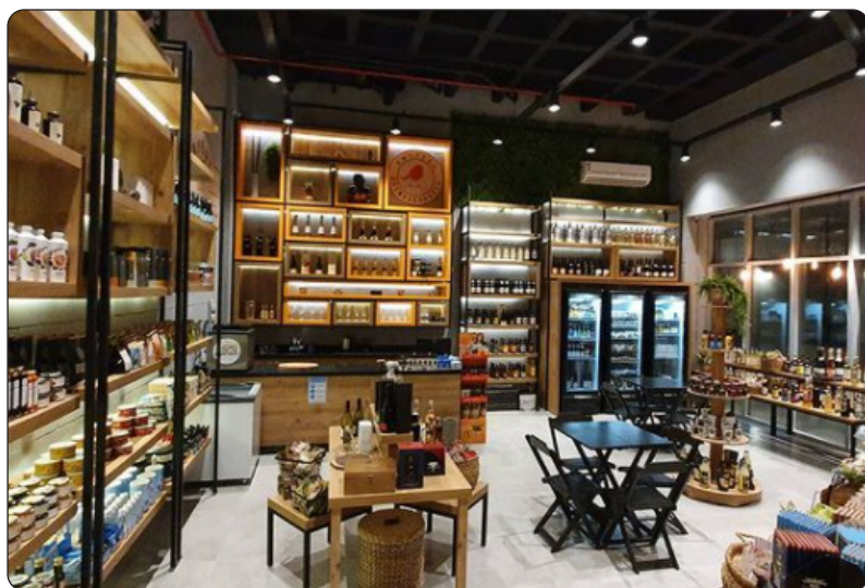
EMPORIUM SOU MAIS BRASIL - Av. Ator José Wilkner, 600 - Loja 111 - Union Square Mall - Barra. Funciona de Terça a Sábado: 15:00 - 21:00h. Instagram: @emporiosoumaisbrasil