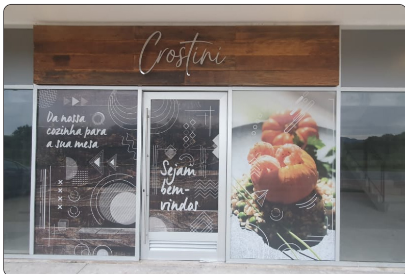
CROSTINI - Av. Ator José Wilker, 400 Loja 127 - Barra Funciona Quinta e Sexta: 18:00 - 00:00h, Sábado: 12:00 - 00:00h e Domingo: 12:00 - 20:00h - Instagram: @crostinigastrobar