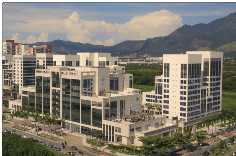
Foto Aérea do Bairro Centro Metropolitano, Janeiro/2021.

urbanísticas do bairro, cuidando da manutenção das ruas, paisagismo, sinalização das vias, limpeza, manutenção de equipamentos que fazem parte de um grande aparato de funcionalidades do bairro, com o objetivo claro de proporcionar a todos os condôminos e frequentadores do Centro Metropolitano, um ambiente limpo, agradável e seguro para boa convivência de todos.