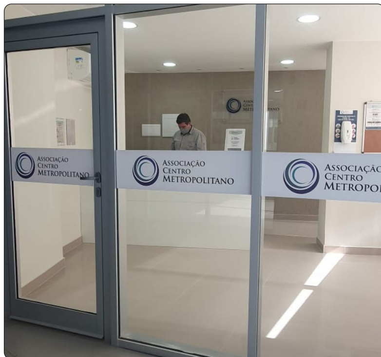
Sede da Associação do Centro Metropolitano no Union Mall.