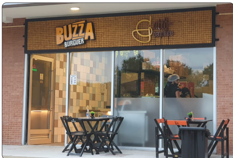
BUZZA BURGUER - Av. Ator José Wilker, 400 - Loja 125 - Barra Funciona de Terça a Domingo: 18:00 - 00:00h Instagram: @buzzaburguer