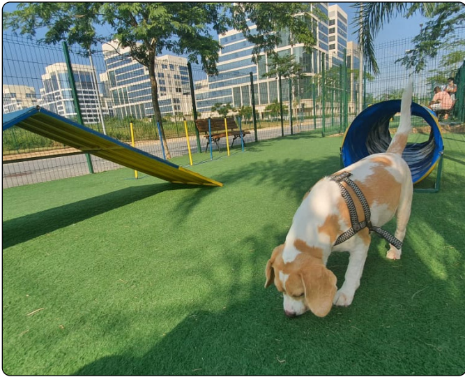
Instalação do novo piso no Play Dog. Centro Metropolitano/Barra.